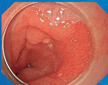
TXI (構造色彩強調機能)

紫と緑の特殊な光をつかい、 わずかな変化を見えやすくして 詳細な観察を助けます。